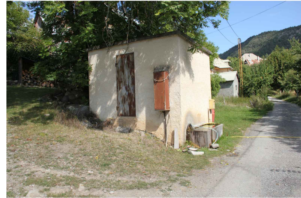
Vue extérieure de la station de pompage