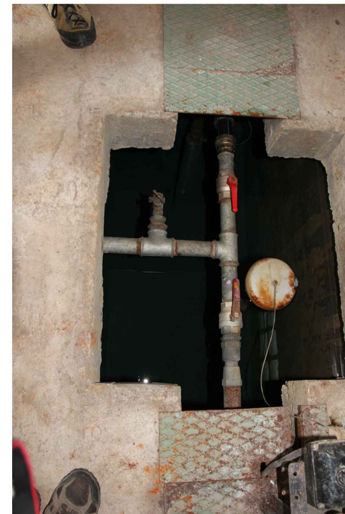
L'intérieur de la station de pompage