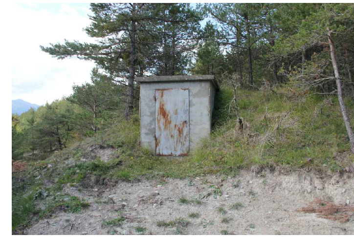
Vue extérieure du réservoir