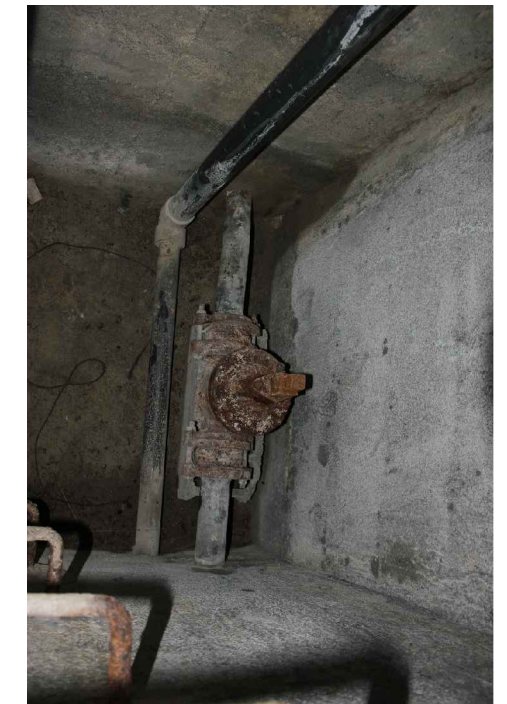
Arrivée de la station de pompage - Distribution