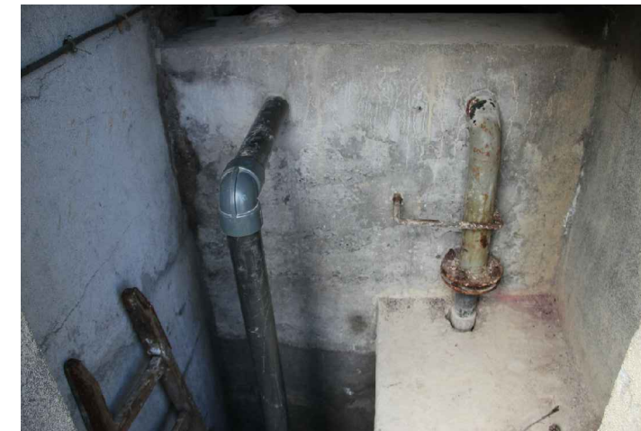
Trop plein - Arrivée de la station de pompage