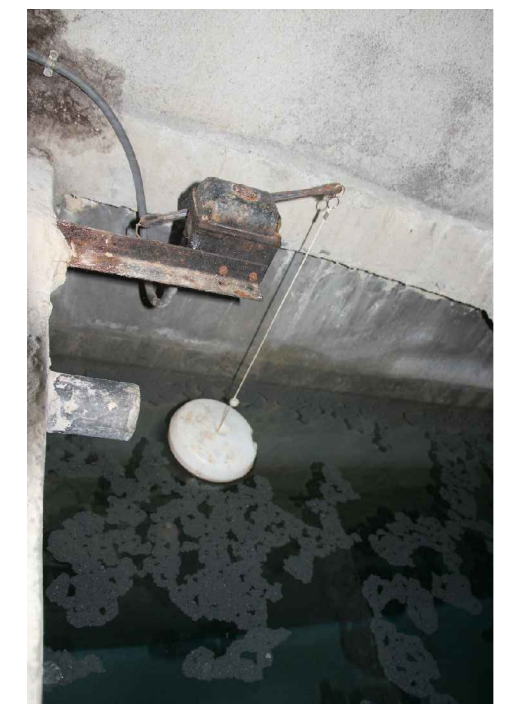
Système de commande des pompes de la station de pompage des Allards