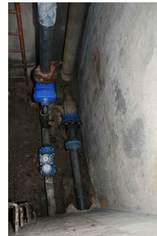
Arrivée de la Source des Sagnes et conduite de distribution avec compteur