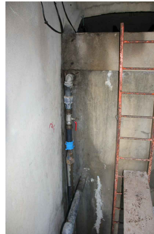
Départ vers réseau des bassins