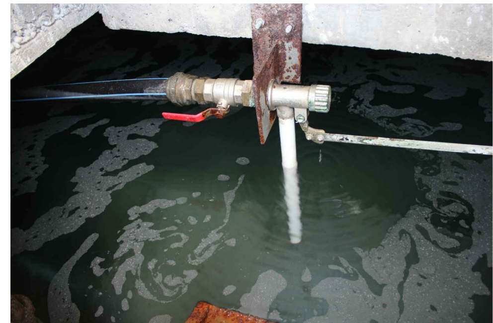
Arrivée gravitaire de la réserve de la station de pompage des Allards