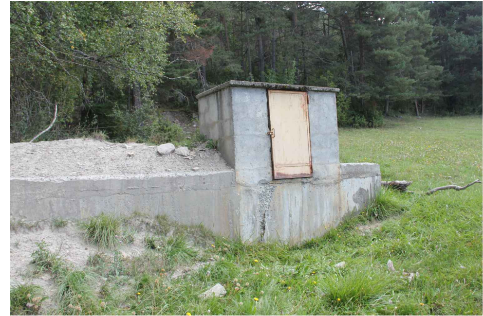
Vue extérieure du réservoir